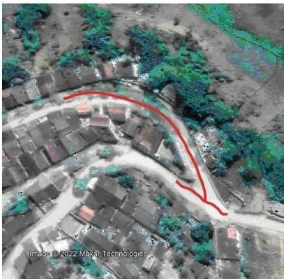
RUA: LUIS DANTAS DE FARIA, BAIRRO ALTO