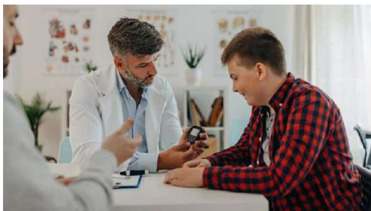
O acompanhamento de um profissional da saúde é fundamental para o tratamento bem-sucedido do sobrepeso nos mais jovens