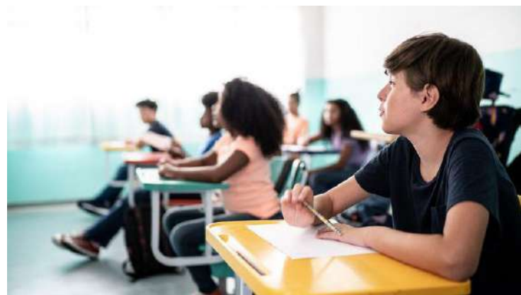
No Brasil, um terço dos meninos e um quarto das meninas têm sobrepeso

A médica, que também é professora do Departamento de Pediatria da Universidade Federal do Paraná, ainda destaca que esses produtos são