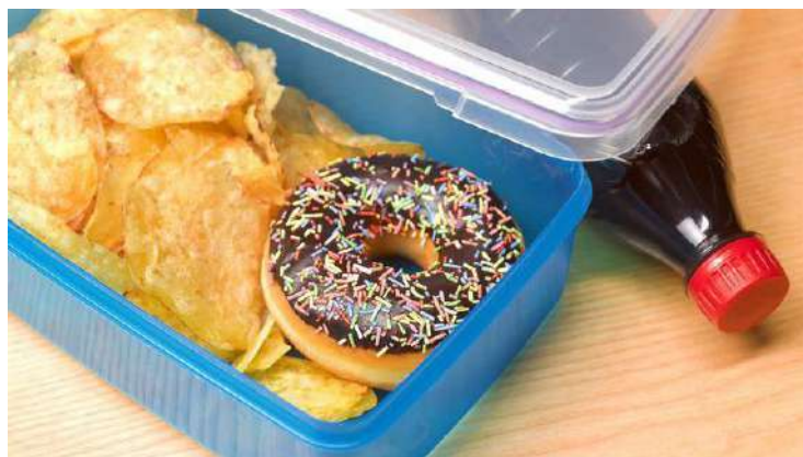
Alimentos ricos em gordura, sal e açúcar ganharam protagonismo na dieta das crianças, apontam especialistas