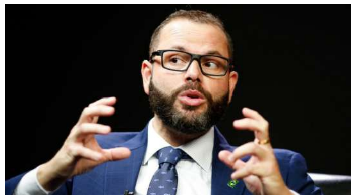
parlamentares conservadores tem que vencer a eleição duas vezes para manter mandato (Senador Jorge Seif).

Depois da cassação de Deltan Dallagnol (Podemos-PR), federal mais votado pelo Paraná, do Deputado Marcelo Crivella (Republicanos-RJ) e do senador Sérgio Moro que luta para manter o mandato. Nas Assembleias Legislativas o fenômeno se repete, no Rio Grande do Norte, o deputado estadual mais votado, Wendel Lagartixa (PL), teve seu registro de candidatura indeferido pelo TSE. – agora o catarinense Jorge Seif é a bola da vez. O Tribunal Superior Eleitoral (TSE) vai retomar, na próxima terça-feira (30), o julgamento do processo que pode cassar o mandato do senador Jorge Seif (PL-SC). Ele é acusado de cometer o crime de abuso de poder econômico durante as eleições de 2022. O recurso no TSE partiu da coligação do PSD, União Brasil e Patriota, que teve como candidato ao senado o ex-governador Raimundo Colombo (PSD). O julgamento do dia 30 deve dividir o plenário do TSE entre a ala mais alinhada aos ideais do ministro Alexandre de Moraes, a mais conservadora. Esta é representada pelos ministros Isabel Gallotti, Kassio Nunes Marques e Raul Araújo. A acusação alega que Seif foi beneficiado por três situações durante sua campanha: a cessão de um helicóptero por um empresário da construção civil, o suposto uso da estrutura da Havan na campanha com interferência direta de Luciano Hang. A vontade popular tem cada vez menos peso na democracia relativa brasileira.