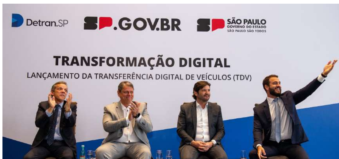
Leia mais no site do DT

O Governo Federal anunciou na manhã desta terça-feira, 12, a criação de 100 novos campi dos Institutos Federais de Educação, Ciência e Tecnologia (IFs). A iniciativa alcança todas as Unidades da Federação e gera 140 mil novas vagas, a maioria em cursos técnicos integrados ao ensino médio. Os detalhes serão anunciados pelo presidente Luiz Inácio Lula da Silva, ao lado dos ministros Camilo Santana (Educação) e Rui Costa (Casa Civil), em cerimônia no Salão Nobre do Palácio do Planalto.