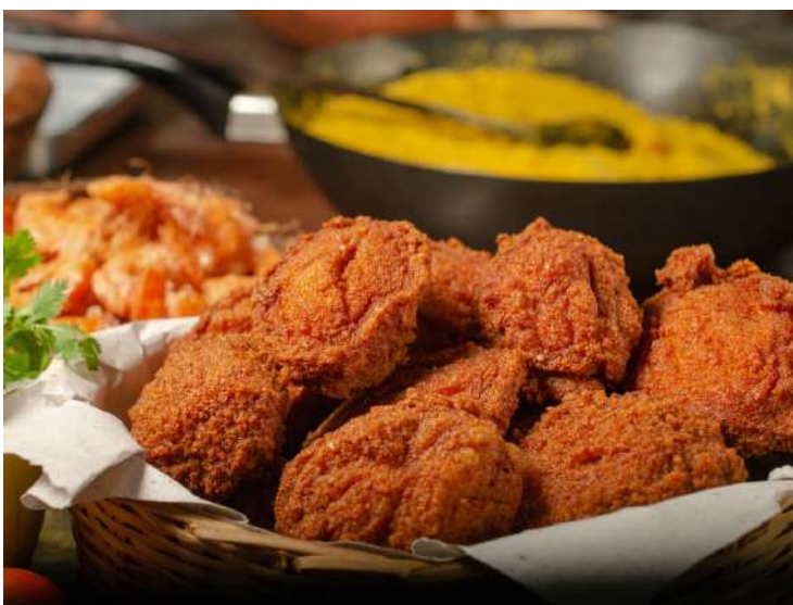
primeira festa nordestina no Shopping Jardim oriente em S. José dos Campos, com bonecos e comidas típicas

Para quem gosta de uma boa comida nordestina, opções não vão faltar na 1ª Festa Nordestina em São José dos Campos. Entre