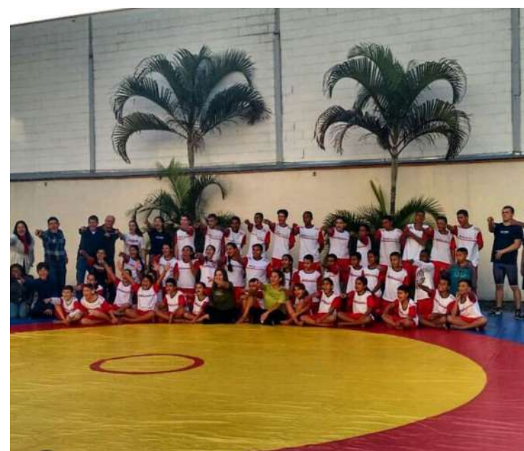
uma das equipes de base da escola esportiva de wrestling da Assecre

Estão abertas as inscrições gratuitas para a escola esportiva de wrestling da ASSECRE - Associação das Empresas do Vale do Paraíba, que funciona dentro da sede da associação. As aulas são em parceria com o projeto Atleta Cidadão da Prefeitura de São José dos Campos, e fazem parte de um dos pilares da entidade que são: educação, cultura, inclusão social e empregabilidade.