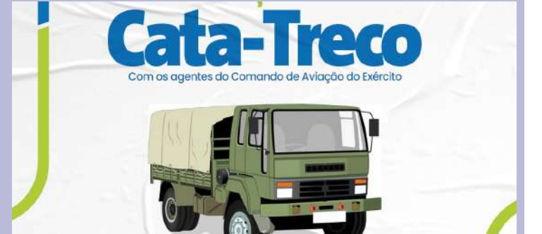
Leia mais no site do DT