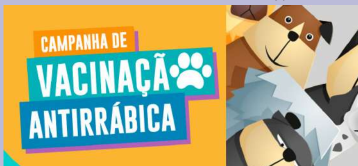
Leia mais no site do DT

Notebooks são entregues para professores da prefeitura de Taubaté