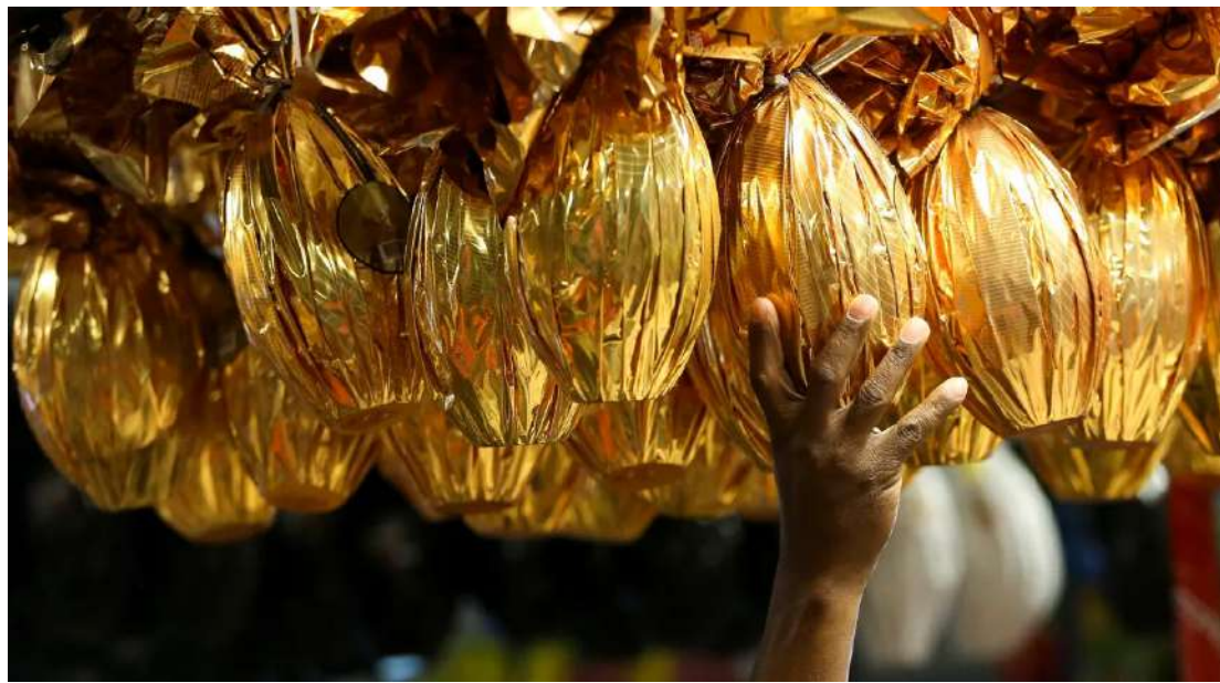
Leia mais no site do DT

SP é 1º estado do país a oferecer transferência digital de veículos