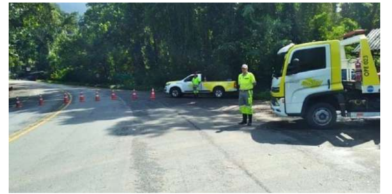
Leia mais na pagina 05

Vacinação antirrábica será realizada na Baronesa nesta quarta