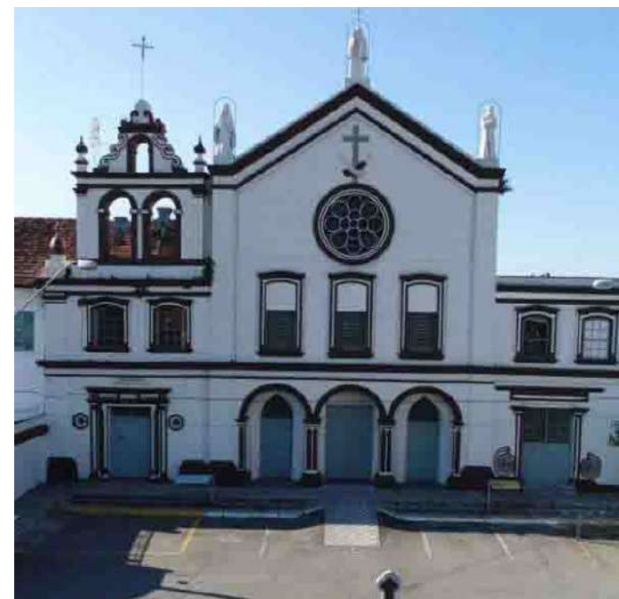
Fachada do Convento Santa Clara, em Taubaté.

Em 25 de março de 1674, foi lavrada a qual os oficiais da Câmara e o povo da Vila se comprometiam a construir o prédio para um convento que abrigaria os religiosos de São Francisco, da Ordem dos Frades Menores da Regular Observância provindos do Rio de Janeiro, sob a invocação de Santa Clara.