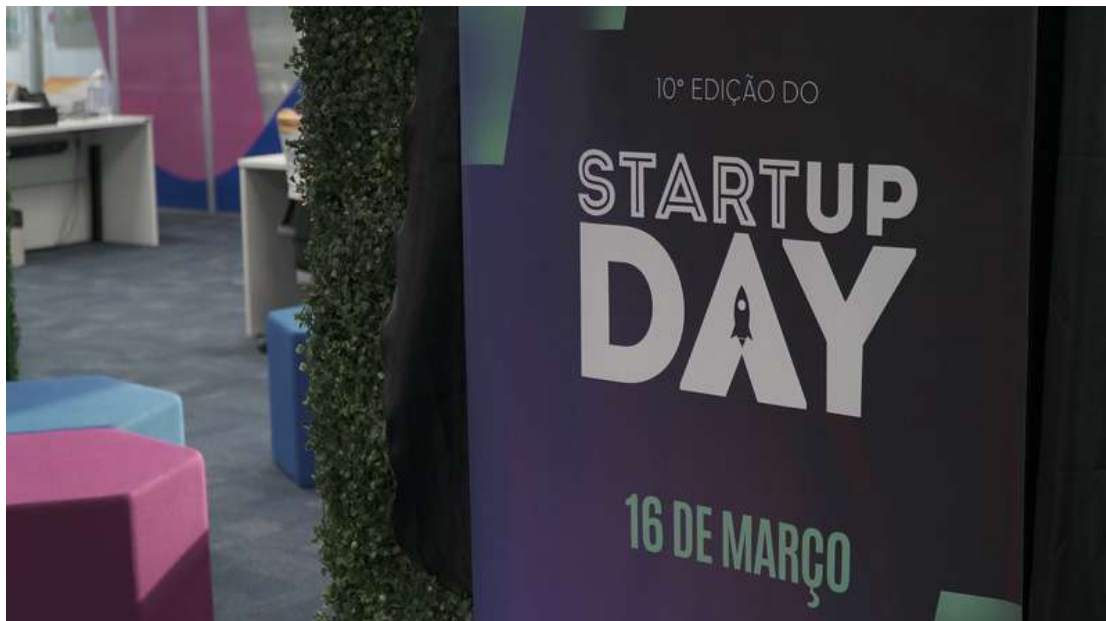
Evento acontece em Taubaté no dia 16 de março

A programação do evento em Taubaté vai contar com palestras e painéis com temas variados, como “desafios e oportunidades de inovação no ecossistema local”, “desbravando oportunidades de negócios Open Source com Inteligência Artificial”, “estratégias de empreendedorismo corporativo e startups na era da Open Innovation”, “Estratégias de marketing para startups”, além da apresentação de cases de sucesso, como no painel “navegando pela trajetória de uma startup: lições aprendidas dos erros, desafios e conquistas”. Por fim, todos os presentes terão a oportunidade de fazer muito network e trocar