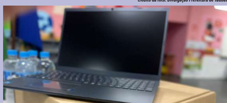
Leia mais no site do DT

Combate à dengue com Operação Cata-Treco segue no Esplanada e Barranco