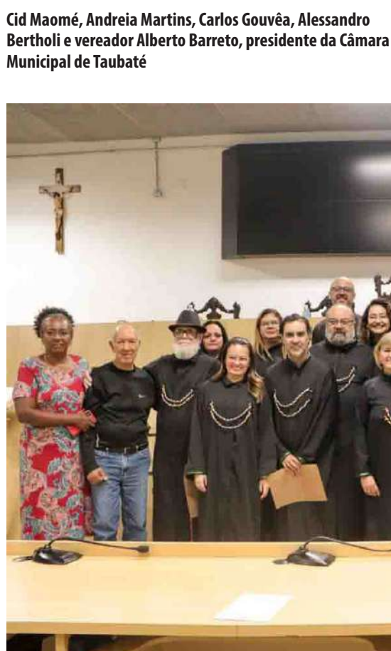
Grupo de Acadêmicos, ao final do evento